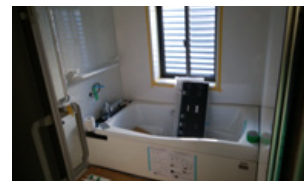
③ユニットバス取付中