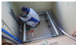
③ユニットバス土台取付中