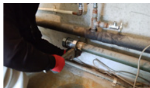
②水道設備 切り直し中